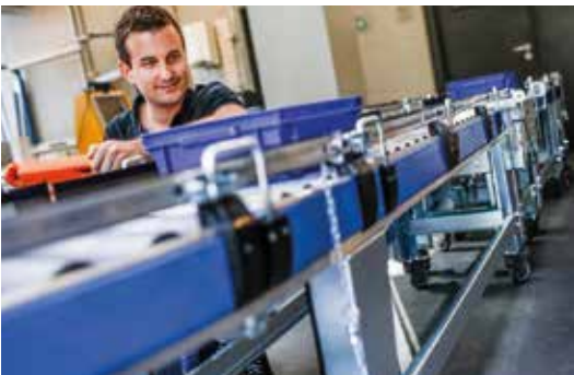
© Gebhardt Fördertechnik GmbH „Fördertechnik-Baukasten FlexConveyor“