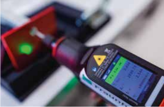
© Fraunhofer IAO „Future Work Lab“