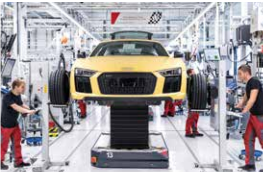
© quattro GmbH „Fahrerlose Transportfahrzeuge“ (Bär Automation GmbH)